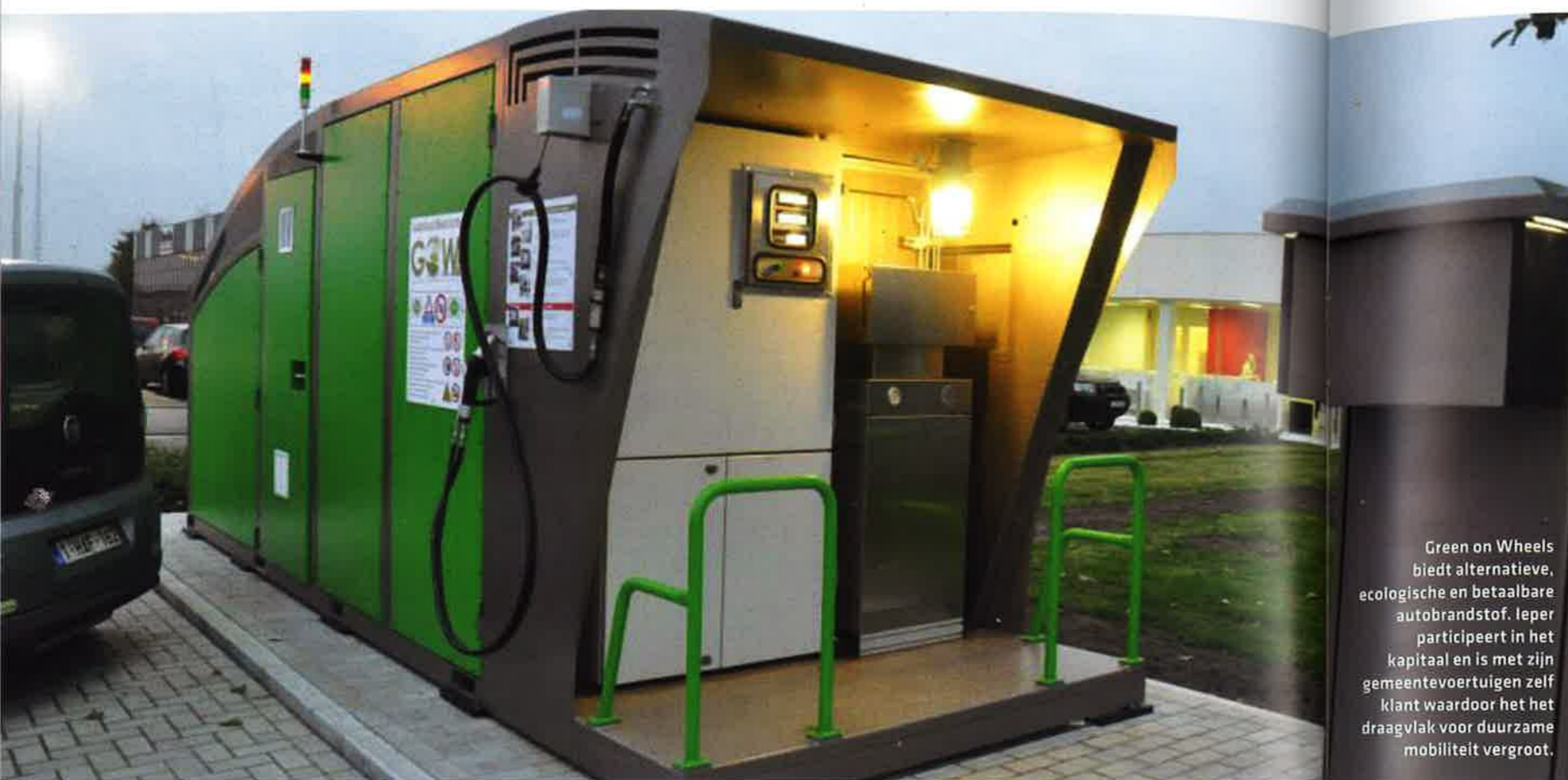
Green on Wheels biedt alternatieve, ecologische en betaalbare autobrandstof. Ieper participeert in het kapitaal en is met zijn gemeentevoertuigen zelf klant waardoor het het draagvlak voor duurzame mobiliteit vergroot.